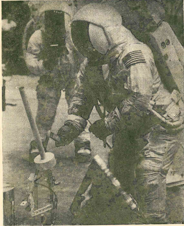
امریکی خلا باز آرمسٹرانگ چہہ زونہ پیتھہ اہم سامانہ تھوان۔